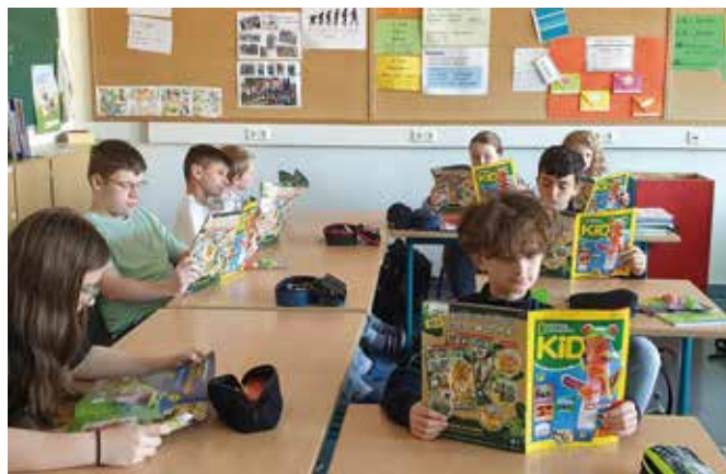
Bald sind wir Froschexperten

der Fokus darauf, Spaß am Lesen zu fördern. Dieses Mal wurden die bildgewaltigen Printmedien im Unterricht gemeinsam analysiert: Seitenzahl, Werbung, Themenvielfalt, Anzahl der Bilder, Länge der Artikel und der Wahrheitsgehalt ... .