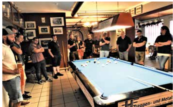
Großes Interesse herrschte bei der 1. Siegenburger Billard-Marktmeisterschaft für Vereine.

gewinnt. Poolbillard ist für Hobbyspieler deshalb interessant, da alle auf demselben Nivo spielen und es keinen großen Unterschied zum Gegner gibt. Um dies etwas zu ändern, bieten die Billardfreunde dazu ein kostenloses Training am Dienstag und Freitag ab 20 Uhr den Teilnehmern an. Eine Mannschaft oder auch ein Team besteht aus vier Mitspielern, ob Frau oder Mann, auch Kinder ab 12 Jahren dürfen mitspielen. Es dürfen keine aktiven Billardspieler der Gastgeber antreten. Es dürfen die Spieler auch ausgetauscht werden. Beginn 11 Uhr mit einem Weißwurstfrühstück, anschließend Auslosung der Paarungen, dabei wird nach dem Schweizer System gespielt. Anschließend Siegerehrung und gemütliches Beisammensein. Die Billardfreunde freuen sich auf zahlreiche Anmeldungen bis 9.7.23 unter www.billard-freunde.de