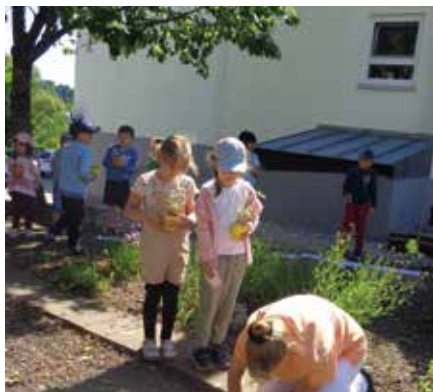
Schon interessant, wie das so funktioniert mit dem Einpflanzen.