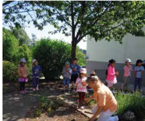
Da ist schon das nächste Pflänzchen.