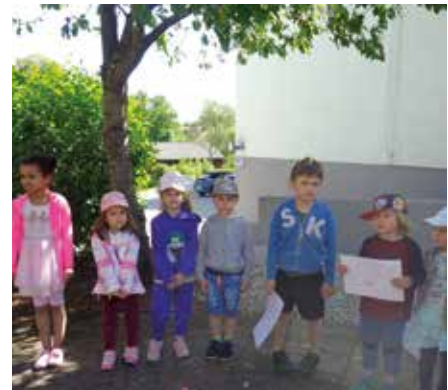
Ganz schön aufregend so ein Tag im Magdalenum!