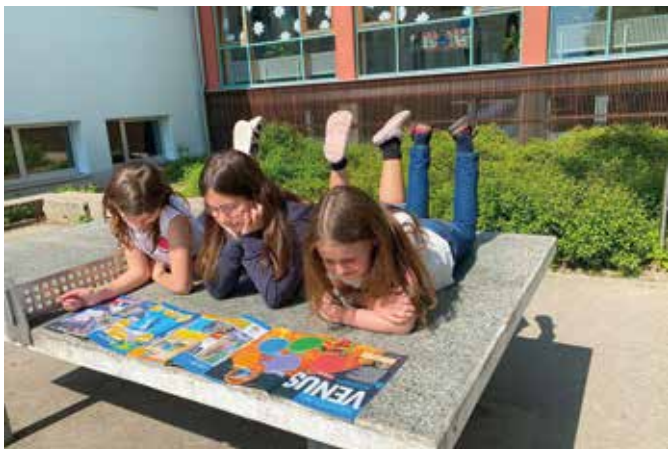
Lesen an ungewöhnlichen Orten