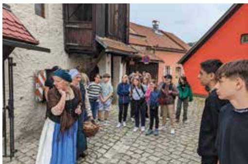
Bei der Stadtführung durch Beilngries

Ein großer Dank für diese schönen Ausflugstage sei an dieser Stelle unseren finanziellen Unterstützern, dem Förderverein der GMS Siegenburg und den Gemeinden des Schulverbands Siegenburg gesagt.