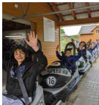
Auf der Rodelbahn