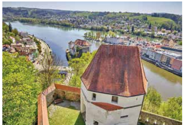
Veste Oberhaus