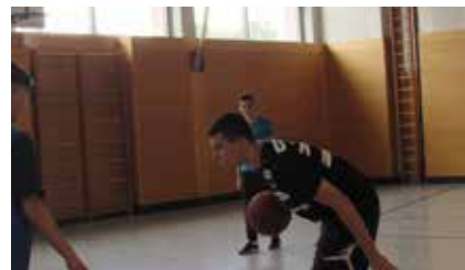
Auch die Technik wurde in Basketball bewertet.

ßen oder Ballweitwurf absolviert. Wir wünschen den Schülern und Schülerinnen noch viel Erfolg bei den weiteren Abschlussprüfungen.