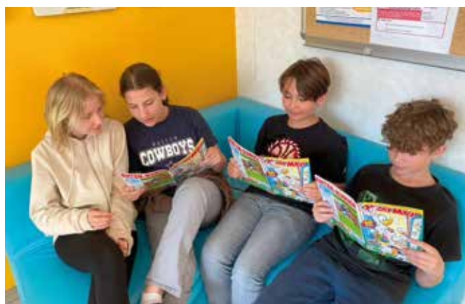
Gemeinsam lesen macht Spaß.