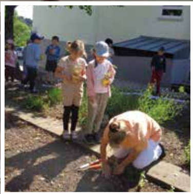
Kindergarten be- sucht Magdalenum