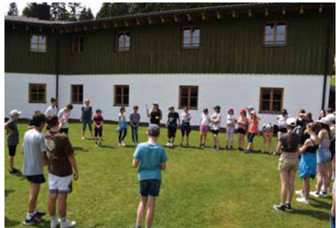
Lustige Spiele im Freien