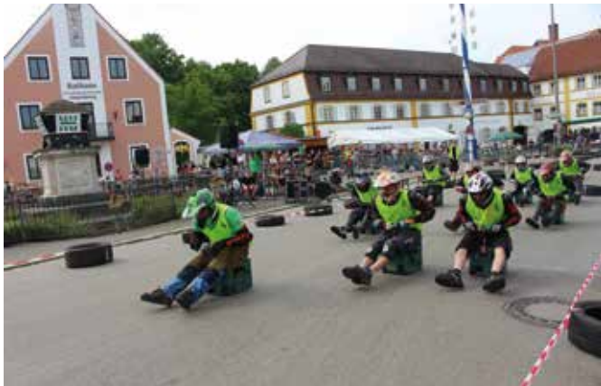
Alle neun Fahrer am Startpunkt