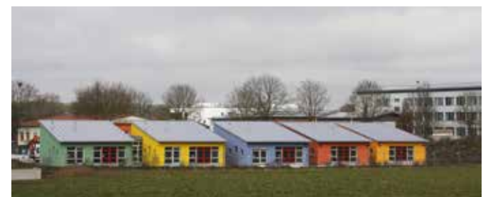
Für den Kommunalen Kindergarten wurden Spielgeräte beschafft.

Aufgrund einer Vergrößerung des Spielgerätehauses fallen zusätzliche Klempnerarbeiten in Höhe von 8.365,60 € brutto an. Das Gremium stimmte dem Nachtrag zu.