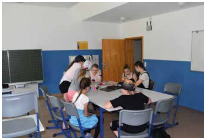
Bei einem der Workshops