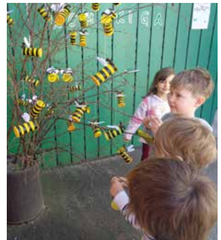
Es summt und brummt in unserem Busch.