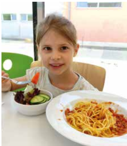
Freudige Gesichter beim Essen