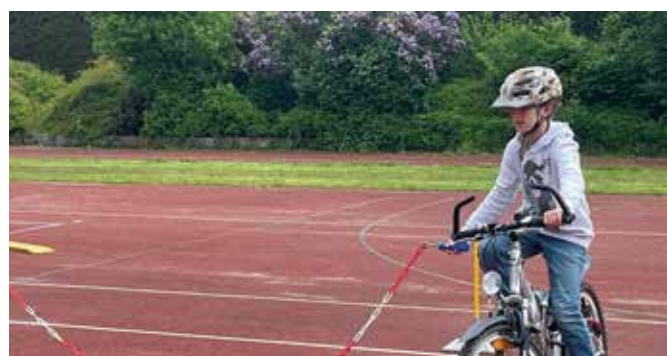
Laurat aus der Klasse 5a