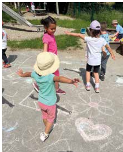
Mit dem Bientanz den Sommer entdecken, eine tolle Zeit!