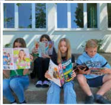
Medien in der Schule