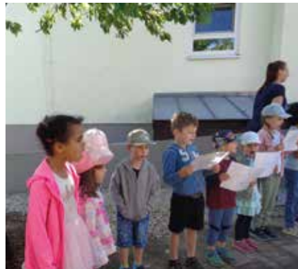
Und gemeinsam mit den Senioren singen wir bekannte Kinderlieder.