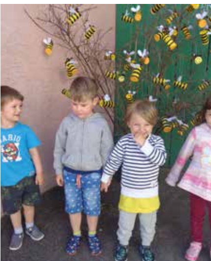
Ist er nicht wunderschön geworden, unser Bienenbaum!