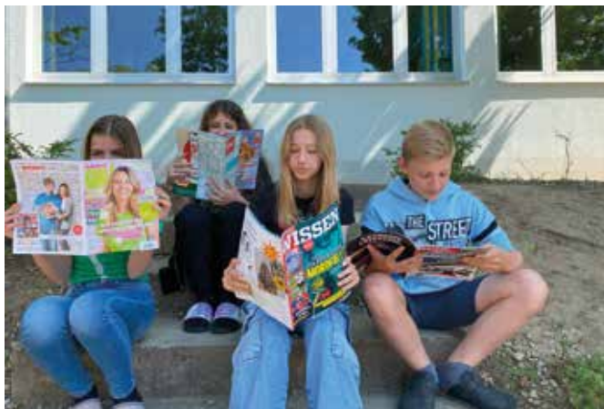
Für jedes Interesse ist was dabei.