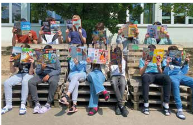
So eine riesige Auswahl