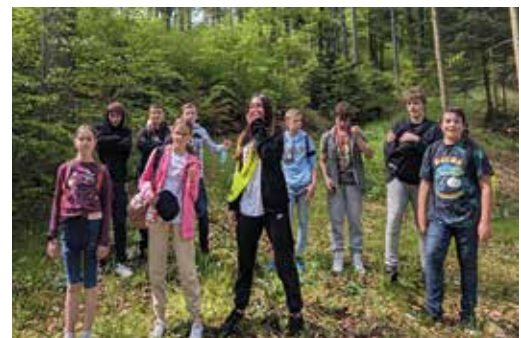
Die erste Pause bei unserer Wanderung