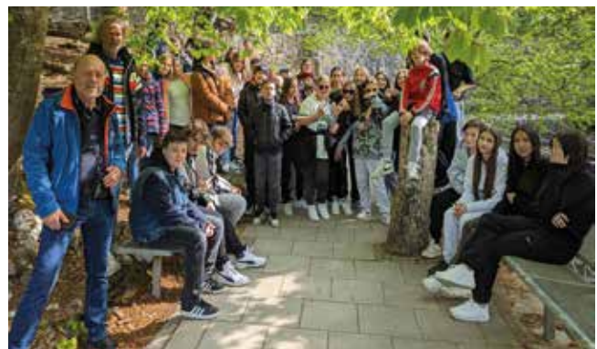
Klasse 6a und 7a vorm Schulerloch