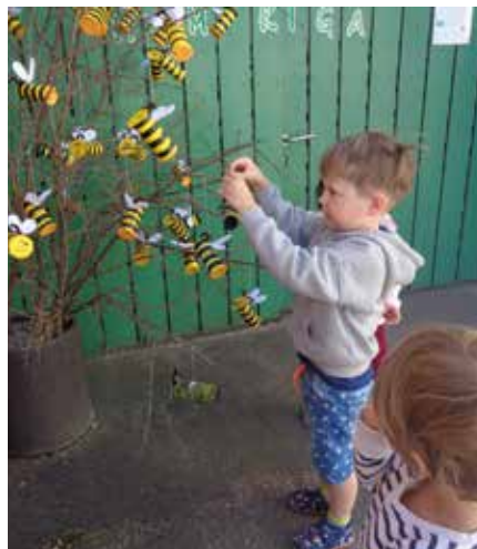
Jede Biene findet ihren Platz.