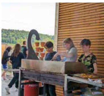
Grillen macht Spaß