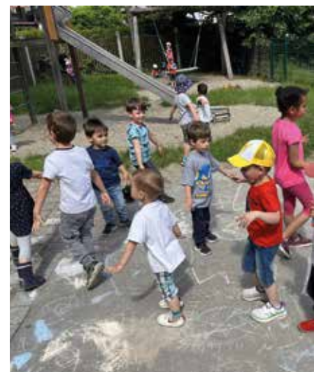
Sum, sum, sum, immer im Kreis herum.