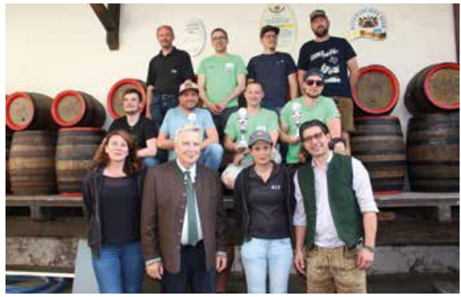
Die Teilnehmer des Bierkistenrennens