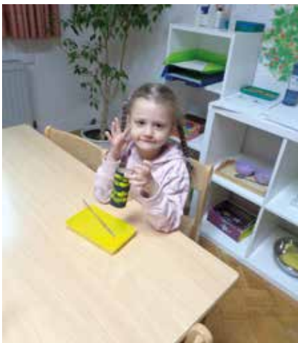
Meine Biene ist fast fertig!

Besonders freuten sich die Bewohner des Siegenburger Seniorenheims „Magdalenum“ über unseren Besuch. Mit einer kleinen Marienfeier am 31. Mai ließen wir den Mai ausklingen. Wir sangen Lieder und beteten ein Gebet. Die selbstgezüchteten Blumen und Pflanzen wurden von uns überreicht und brachten somit den Sommer ins Haus. Auch wir wurden beschenkt. Jeder von uns bekam eine wunderschöne Blume. Vielen herzlichen Dank dafür!