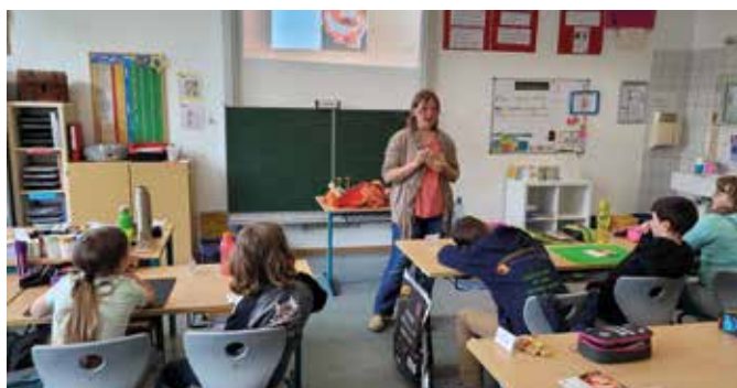
Demonstration zum Schutz des Embryos durch das Fruchtwasser

An dieser Stelle möchte die Schulfamilie ein herzliches Dankeschön an unsere Hebamme Frau Frisch für die einfühlsame Behandlung dieses Themas mit unseren Schülern ausdrücken!