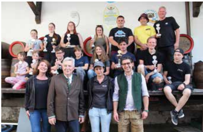
Die Gewinner des Seifenkistenrennens