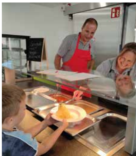
Für den etwas größeren Hunger steht stets Nachschlag bereit.