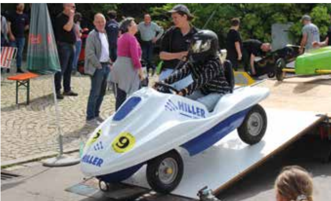
Auf der Startrampe