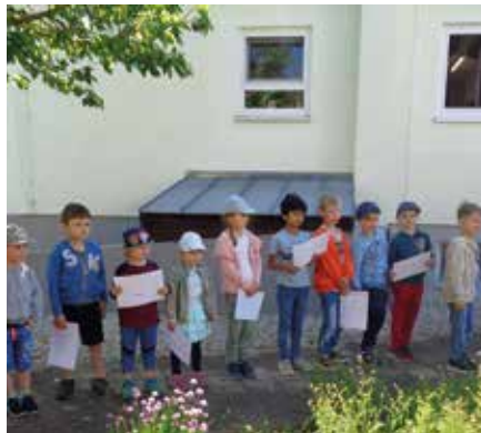
Stolz präsentieren wir unsere Marienlieder.