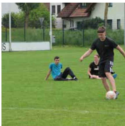
Das Dripping beim Fußball musste passen.