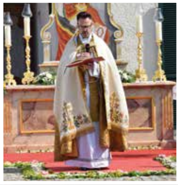
Fronleichnam in Siegenburg

In dieser Ausgabe lesen Sie unter anderem: