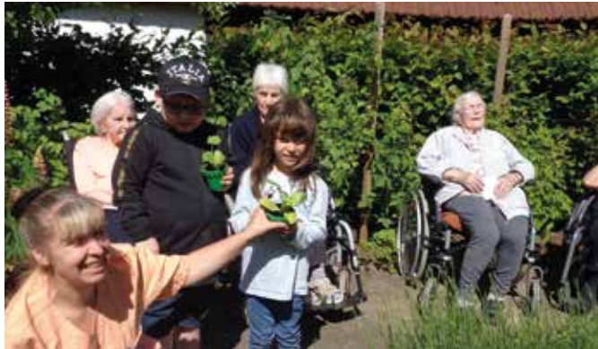
Pflänzchen für die Beete im Altenheim