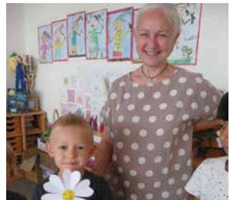
Vielen herzlichen Dank für die wunderschöne Blume und den netten spontanen Besuch!