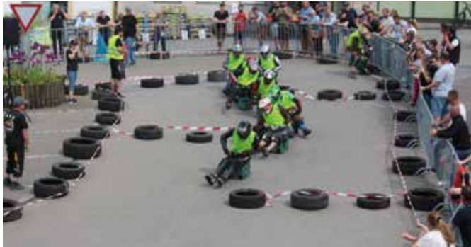
Der Marktplatz wurde zum Motodrom.