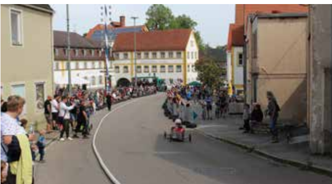
Vom Kircherberg herab