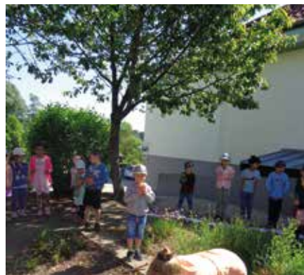
Es wird genau beobachtet, was da passiert.