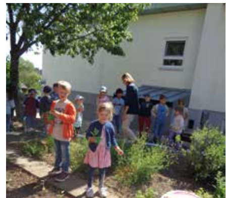
Eines nach dem Anderen findet seinen Platz in der Erde.