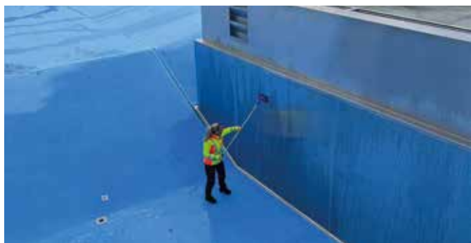
Die Fugen im Schwimmbad waren marode.

Die Spezialfirma Buch aus Neustadt a.d. Donau hat im Frühjahr die Fugen im Becken des Freibades erneuert. Diese Arbeiten sind im Abstand von 6 bis 8 Jahren notwendig. Die Fugen waren sehr morsch, dies führte zu einem erheblichen Austritt von Wasser aus dem Becken. Die Kosten für die Sanierung der Fugen betrug 20.697,72 €. Das Gremium stimmte dem Betrag zu.