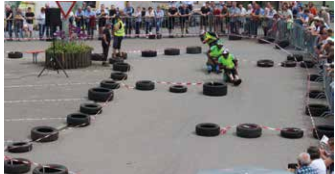
Um jeden Platz wird gefightet.