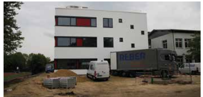
Für die Freianlagen an der Schule liegt ein Nachtragsangebot vor.

In Absprache mit dem Büro für die Freianlagen hat die beauftragte Baufirma ein Nachtragsangebot in Höhe von 41.000 € brutto vorgelegt. Das Gremium vertagte die Entscheidung. Es soll der Bauausschuss den Nachtrag vor Ort mit dem Planungsbüro und der Tiefbaufirma besprechen. Erst in der kommenden Sitzung im Juli wird abschließend über den Nachtrag entschieden.