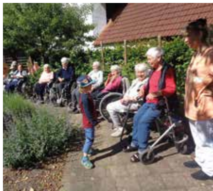
Die Senioren genossen unseren Besuch, eine tolle Überraschung für alle!