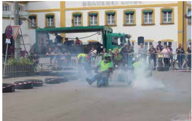
Das letzte Benzin wird „verblasen“.