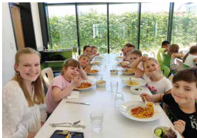
Gemeinsam macht das Mittagessen erst richtig Spaß.