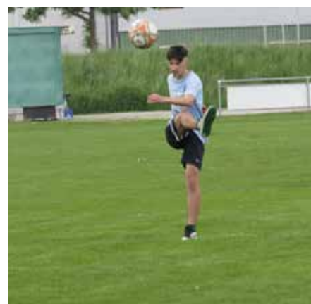
Ein gekonnter Schuss