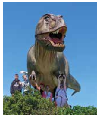
Der Dinopark war ein besonderes Highlight