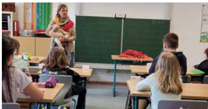
So viel wiegt ein Neugeborenes. Vorsicht mit dem Köpfchen!