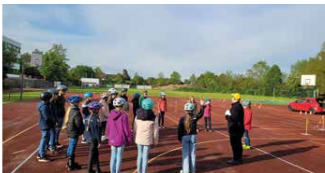
Die Klasse 4a hört aufmerksam zu.