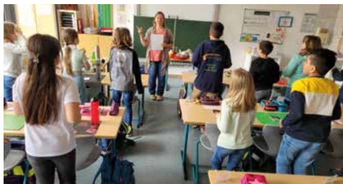
Quiz zum Abschluss - Wenn die Antwort ja lautet, dann dreht ihr euch!