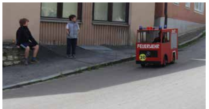
Der Mannschaftswagen der Feuerwehr Ast