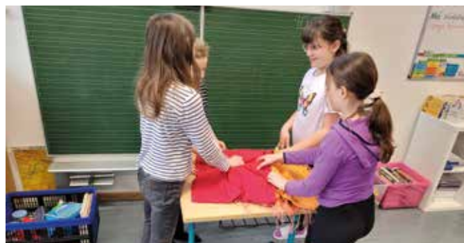
Was könnte sich unter dem Tuch verstecken?