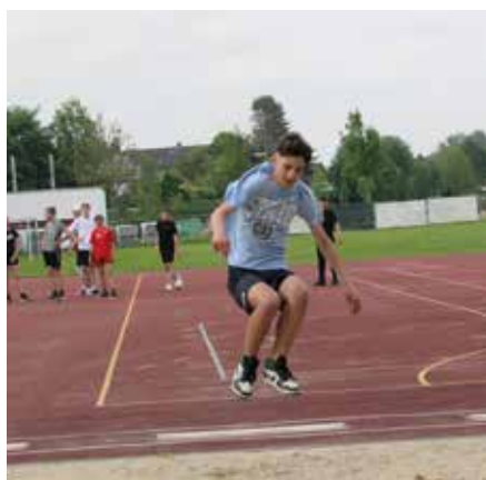
Eine Disziplin in Leichtathletik war der Weitsprung.