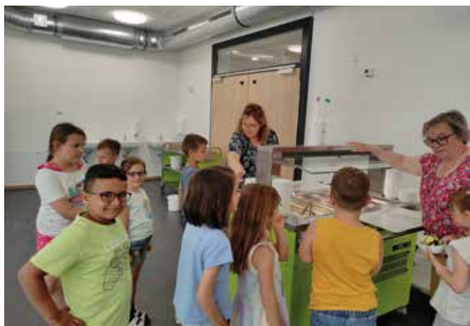
Die Salatbar ist besonders heiß begehrt.

beim Essen eine entspannte Wohlfühlatmosphäre ohne große Wartezeiten geschaffen. Das Küchenteam kocht stets frisch vor Ort sowie gesund und abwechslungsreich. Das stößt bei den Kindern und Jugendlichen auf großen Zuspruch. Neben einem warmen Hauptgericht gibt es eine frische Salatbar und eine kleine Nachspeise für jeden Gast. Falls die Mensabesucher einmal nicht satt werden, dürfen sie sich jederzeit Nachschlag holen. Nach einigen Wochen in Betrieb kann zufrieden festgestellt werden, dass die neue Schulmensa bereits jetzt ein voller Erfolg ist und von den Schülerinnen und Schülern sowie dem restlichen Schulpersonal begeistert angenommen wird.