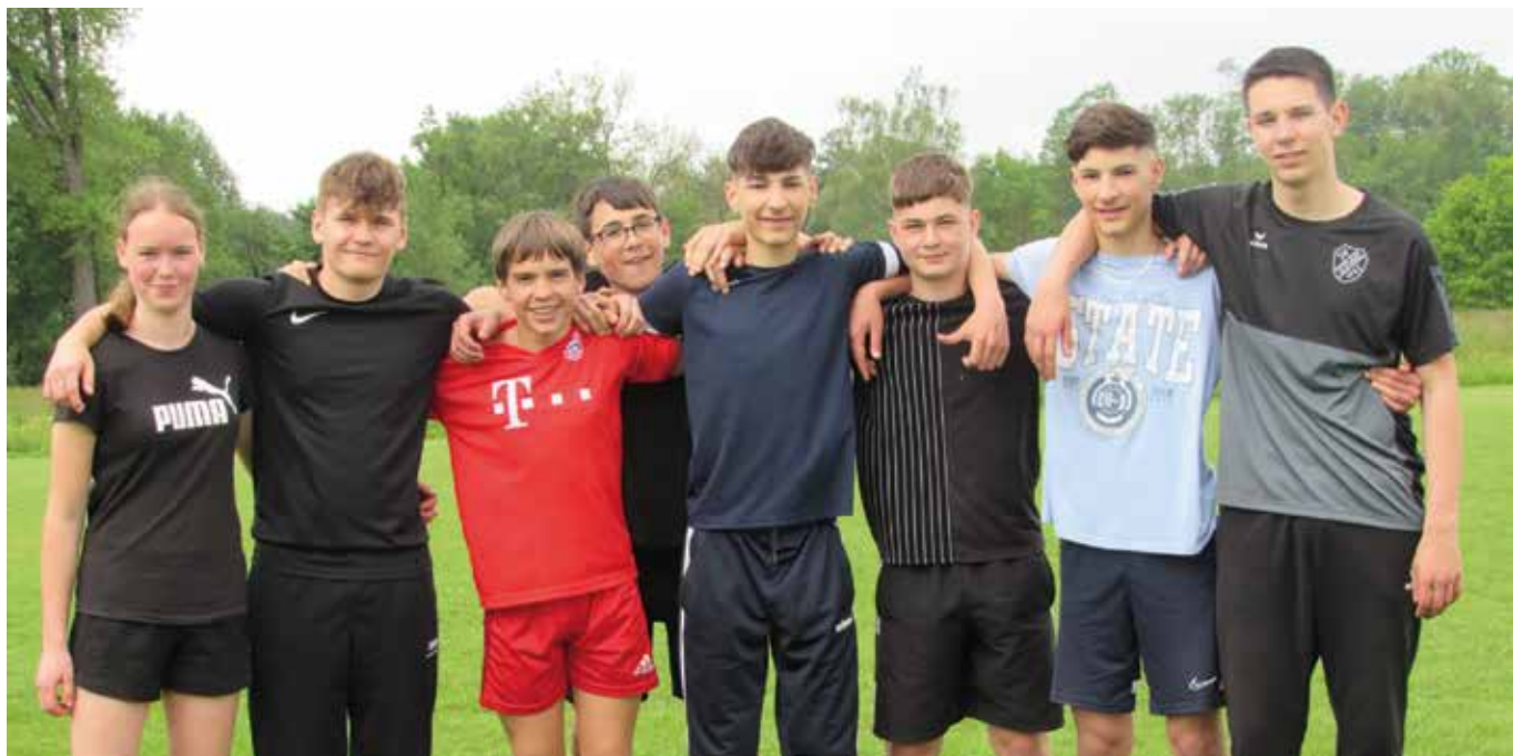
Einige Teilnehmer des Sportqualis