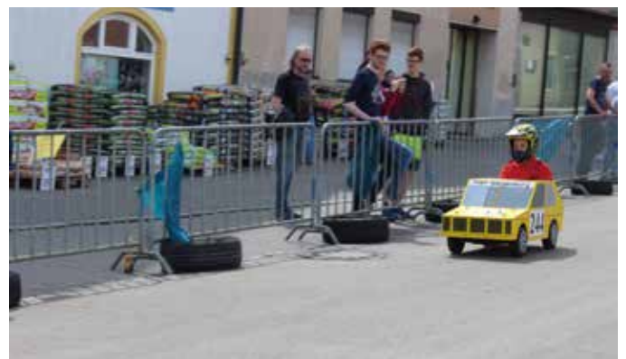
Das kleine Seifenkisterl vom MSF