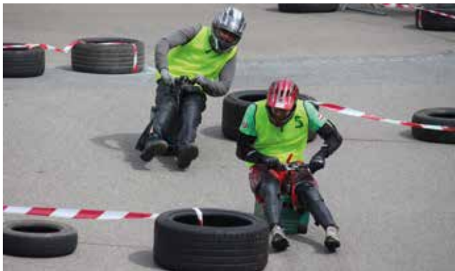
Kampf um die Plätze