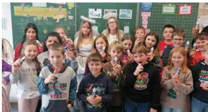
Die Klasse 4a lässt sich ihren Schokonikolaus schmecken