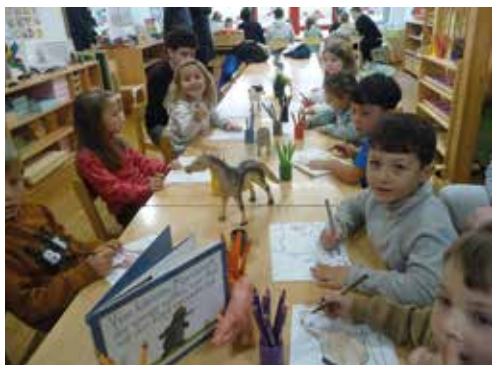
und anschließend verarbeiteten wir den Inhalt malerisch und kreativ.