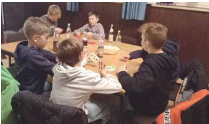
Spieleabend - ganz konzentriert ging es zur Sache

ten. Das hat uns sehr gefreut. Wir hatten einen schönen und lustigen Abend und sagen Danke an alle die ins Kolpingheim gekommen sind.