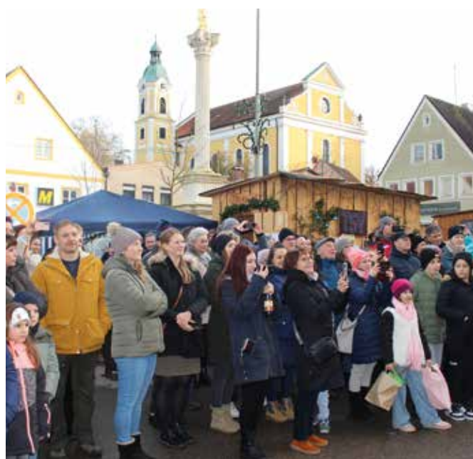
Zuschauer vor der Bühne

Auf Bilder der Kinder auf der Bühne wird hier verzichtet, da nicht jedes Kind auch abgebildet werden darf. Es sei hier versichert das alle Kinder absolut perfekt auf der Bühne sangen und spielten. Wir sind sehr stolz auf die Kleinen aber auch auf die betreuenden Erzieher/Lehrkräfte!