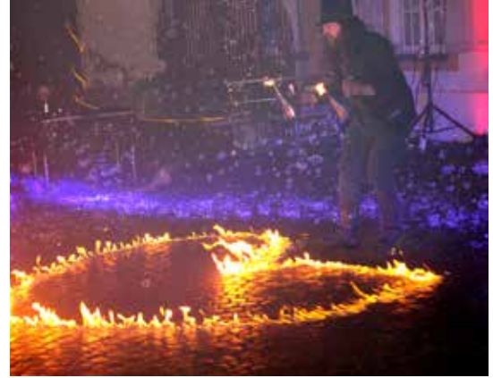
Pyrostyx zauberte ein Herz für unseren herzigen Christkindlmarkt