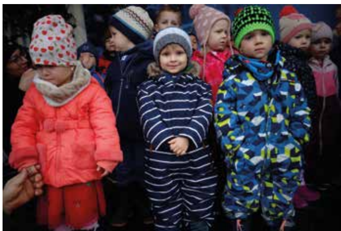
Wir singen auf dem Siegenburger Weihnachtsmarkt.