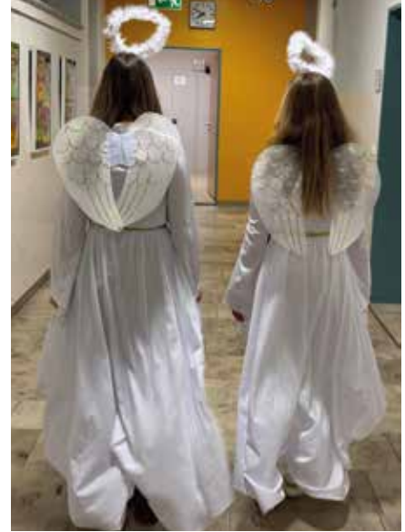
Weihnachtszauber weht durch die Gänge