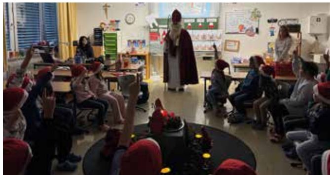
Alle Kinder sind mit Eifer dabei

ein Hauch von Adventszauber an der Herzog-Albrecht-Schule