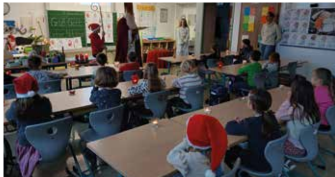
Der Nikolaus lobt die Klasse 1a