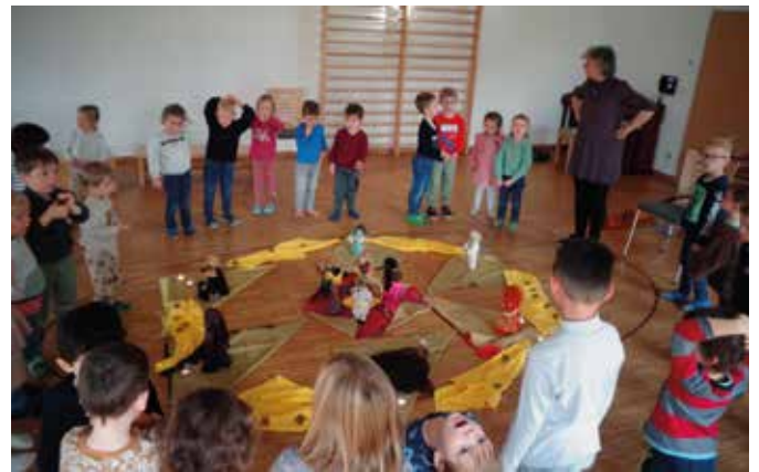
Es wurde zu einem gemeinsamen Erlebnis, dass uns noch lange in Erinnerung bleibt.