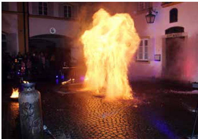
Pyrostyx verschwand in einer Feuerwand