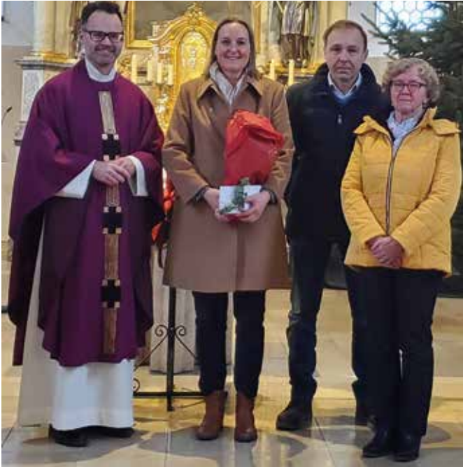
Organistin 40 Jahre