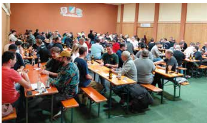
Einhundert Spieler waren dabei.