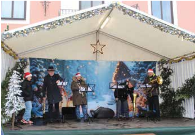
Die Trainer Stadlbläser