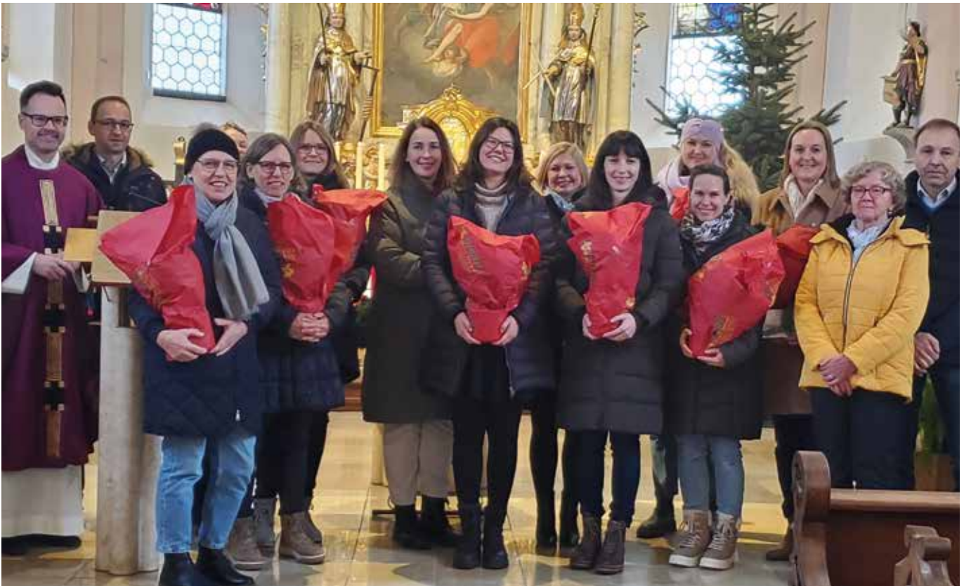
Kolibris 35 Jahre