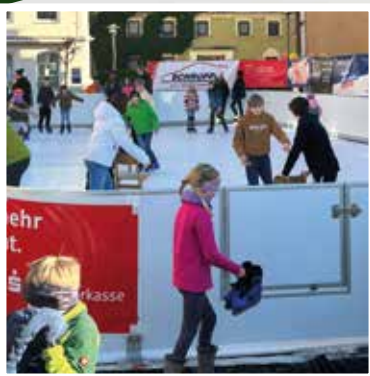
Eisbahn im Markt Siegenburg

In dieser Ausgabe lesen Sie unter anderem: