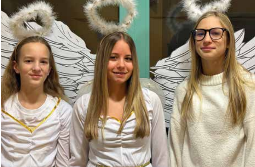
Unsere fleißigen Engel aus der 7a

ein Hauch von Adventszauber an der Herzog-Albrecht-Schule