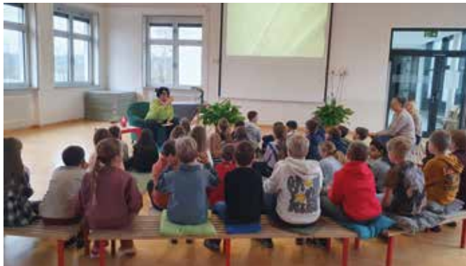
Unsere Rektorin liest aus dem Wunschkirsch von Michael Ende vor