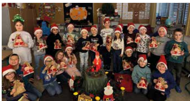
Die 1b freut sich über ihre Nikolaussäckchen