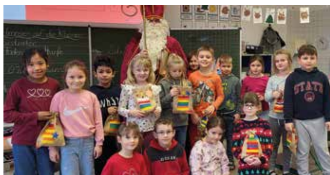
Klassenfoto der 2c mit dem Nikolaus