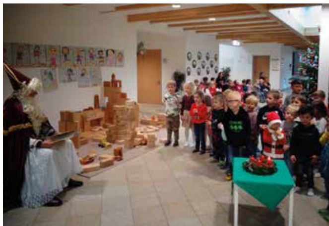
Mit dem Fingerspiel „Lieber guter Nikolaus, stampf doch auch in unser Haus ...“ machten wir dem Nikolaus große Freude.