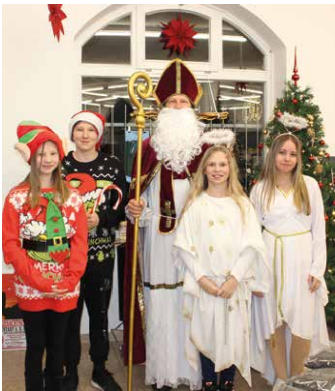
Ein himmlisches Gespann beschenkte die Kinder in Maiks kleiner Welt.