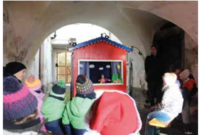
Das tolle Kasperletheater der JU im Gewölbe.