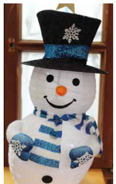
Deko beim MSF - wir freuen uns auf nächstes Jahr!

Auf Bilder der Kinder auf der Bühne wird hier verzichtet, da nicht jedes Kind auch abgebildet werden darf. Es sei hier versichert das alle Kinder absolut perfekt auf der Bühne sangen und spielten. Wir sind sehr stolz auf die Kleinen aber auch auf die betreuenden Erzieher/Lehrkräfte!