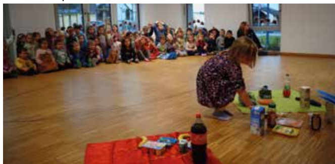
Dabei lernen wir beim Legespiel, gesunde und weniger gesunde Lebensmittel näher kennen.