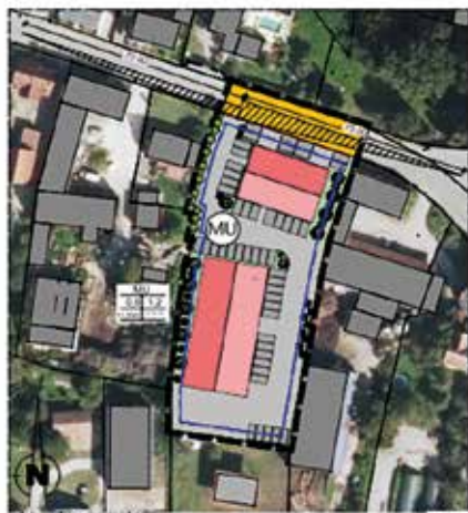
Bebauungs- und Grünordnungsplan "MU Landshuter Straße"

Auf dem Grundstück mit der Flurnummer 901, Landshuter Straße soll ein Ärztehaus sowie ein Baumarkt errichtet werden. Das Grundstück mit einer Fläche von 3802 qm war die Hofstelle eines landwirtschaftlichen Betriebes mit Hopfenbau und Schweinehaltung.