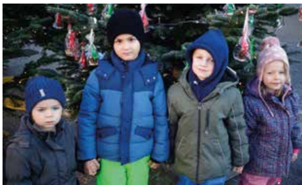
Das Weihnachtsbaumschmücken am Marktplatz darf zu dieser Zeit natürlich nicht fehlen.