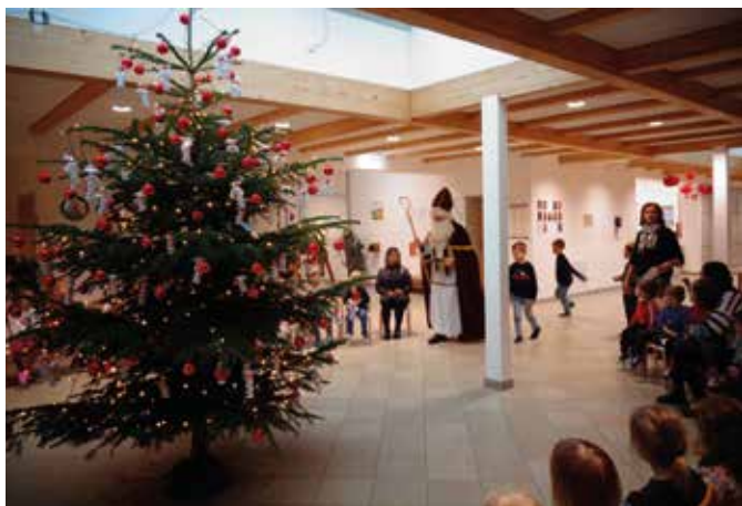
Es ist Dezember und na klar, der Nikolaustag der ist da.