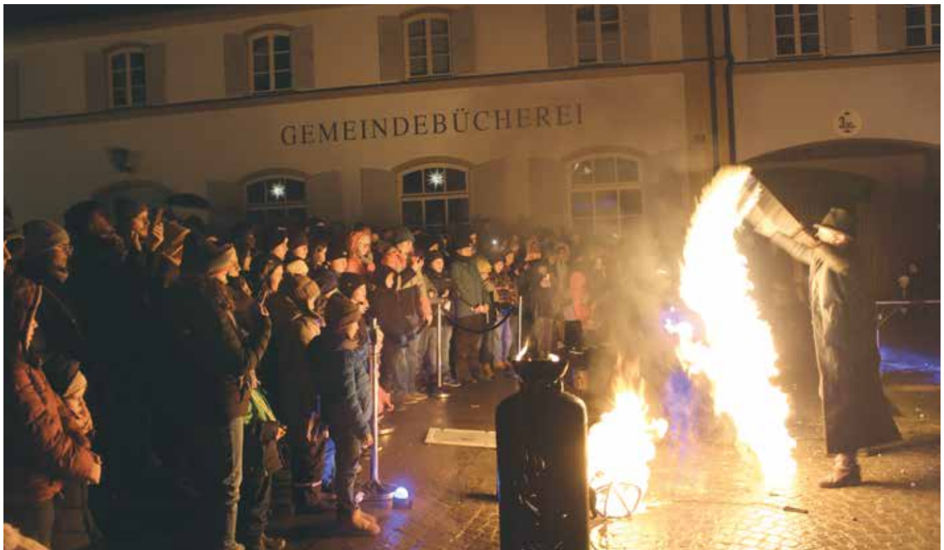
Das Publikum war begeistert!