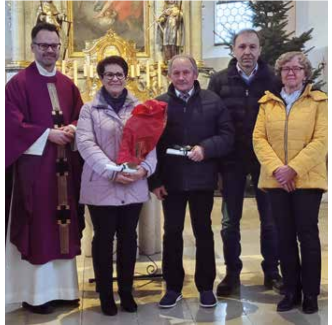
Mesner 25 Jahre