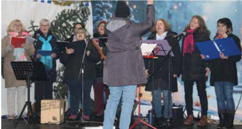
Der Projektchor auf der Bühne