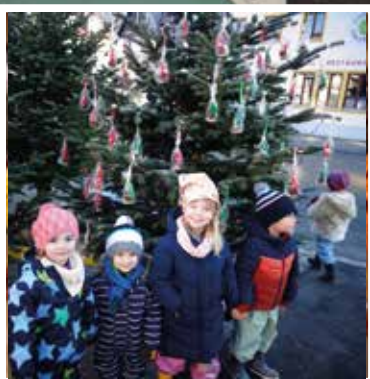
Weihnachtsbaum- aktion am Marktplatz