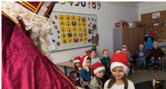
Jeder bekommt persönlich sein Nikolaussäckchen