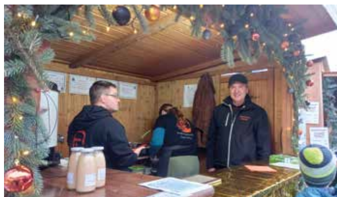
Das Geschäft brummt