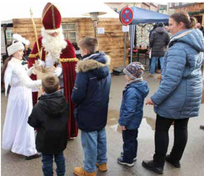
Der Nikolaus beschenkte die Kinder