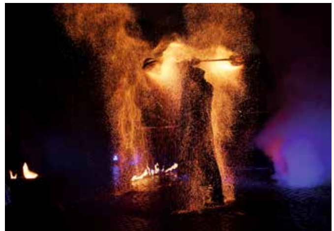
Es funkelte, warm wurde es auch