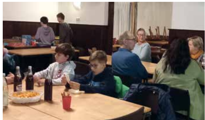
Spieleabend - Viel los war im Kolpingheim