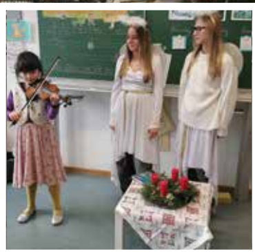
Nikolausaktion in unserer Schule