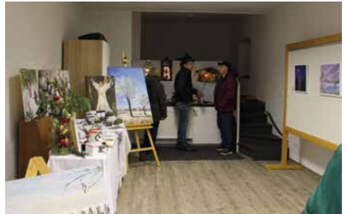
In der Kunstaussstellung