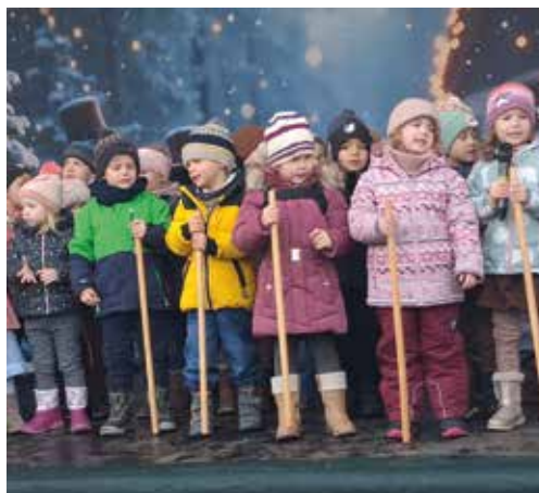
Der Nikolaus ist hier. Schon klopft er an die Tür.