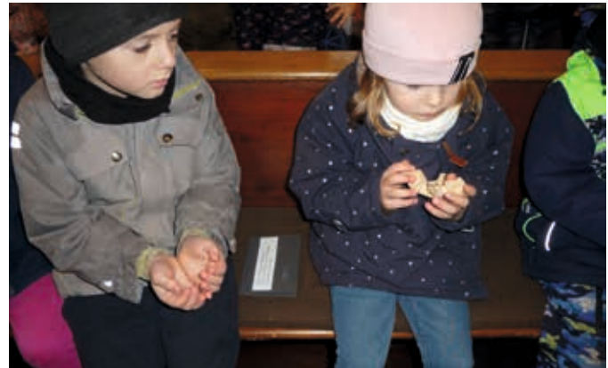
Wir halten in den Händen das kleine Jesuskind!