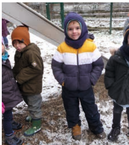
Auf Entdeckungsreise in den kalten Wintertagen