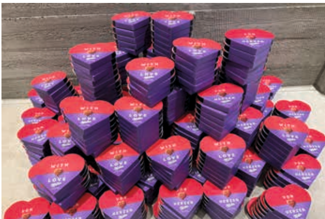
Unzählige Valentinschokoherzen wurden für die Verschenkaktion besorgt.