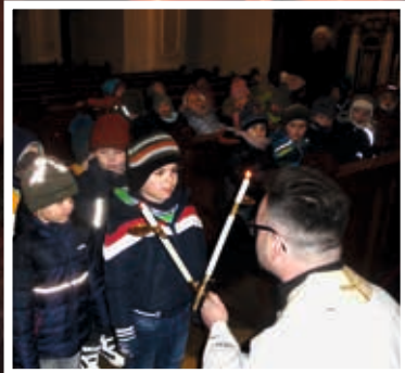
Blasiussegen für die Kids des Kom- munalen Kinder- gartens