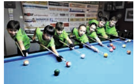
Die Billardfreunde Mühlhausen setzen weiter auf den Nachwuchs und bieten kostenloses Billardspielen für Kinder und Jugendliche an.