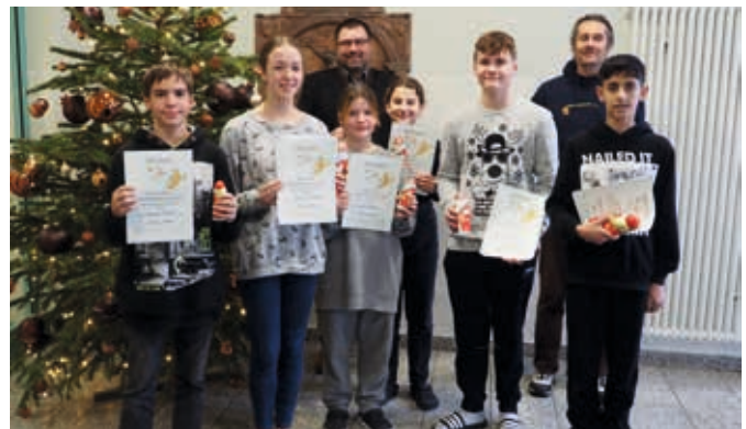
Platz 1-3 bei Jungen und Mädchen