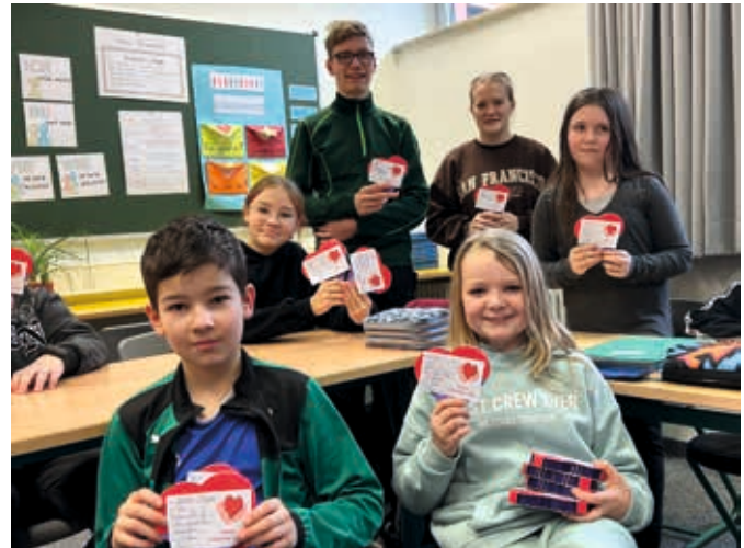
Auch in der 5. Klasse herrschte große Freude über die Schokoherzen.