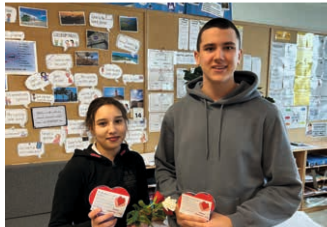
Zwei Schüler der 9. Klasse mit ihren Valentinstagsgeschenken