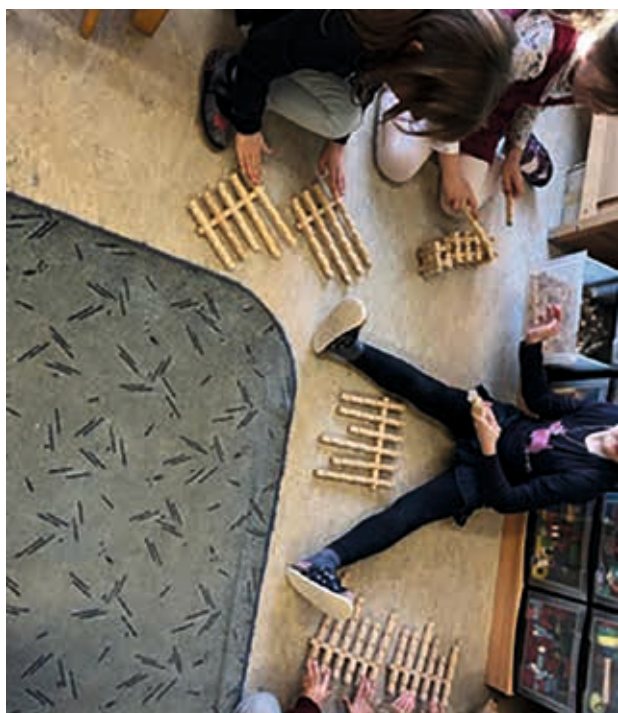
Wir haben in unseren Gruppen auch selbst Musik Instrumente gebaut...