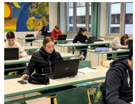
Schüler der Wirtschaftsgruppe beim Erstellen des Geschäftsbriefes