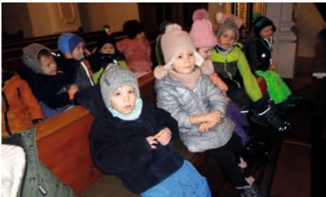
In der Kirche