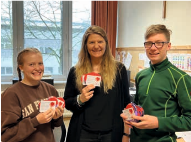
Auch die Sekretärinnen der Schule wurden von Schülern und Lehrern überrascht.