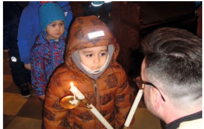
Wir bekommen den Blasiussegen.