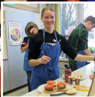
Valentinstag in der Schule