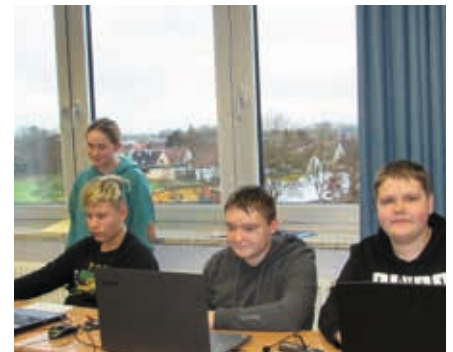
Internetrecherche im Team