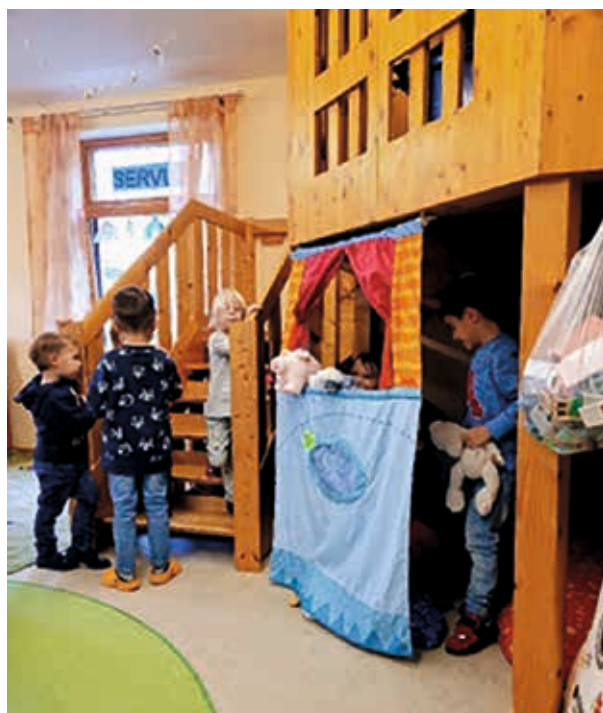
...ein super Puppentheater inszeniert...