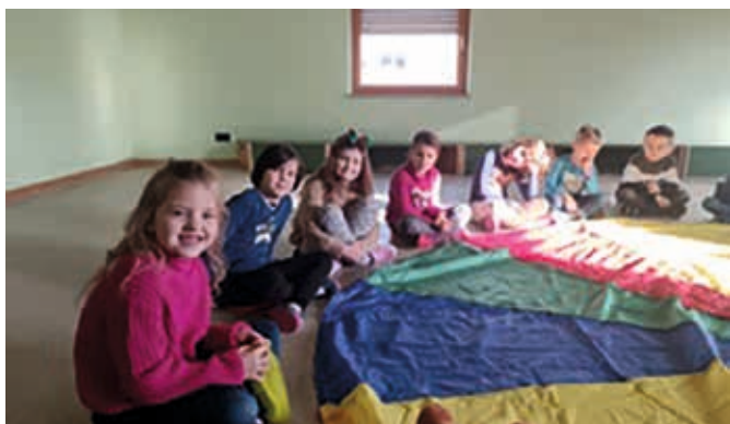
Die Verkehrserziehung; eine sehr interessante und hilfreiche Unterstützung, die uns im Alltag sehr gut helfen wird.