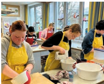
Jedes Team arbeitete in einer Küchenkoje.