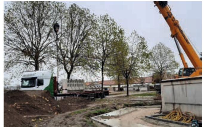
Mehrere Tonnen wiegt ein Bauteil!