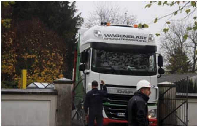
Milimeterarbeit um den LKW durch das Tor zu bewegen!