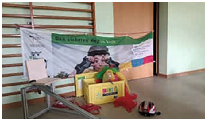
Wir haben sogar eine Move-It Box geschenkt bekommen. Vielen Dank dafür!