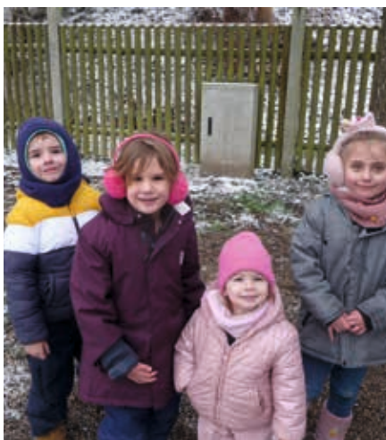
Der Schnee lockt uns in den Garten.