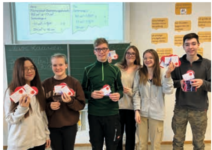
Große Freude über die Überraschungen