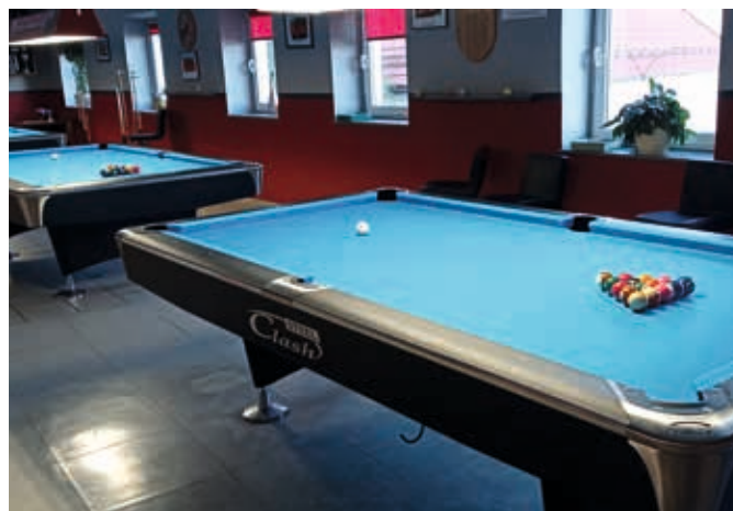
Die neuen Tische im Billardheim sind wieder spielbereit.