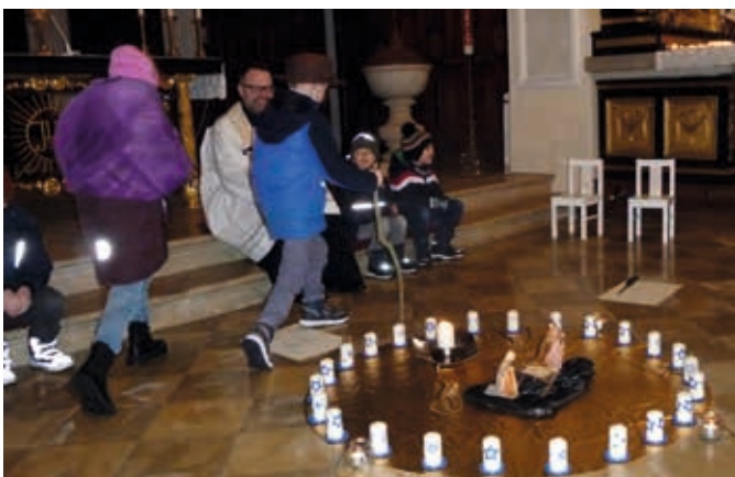
Wir ziehen mit Freude zu einem großen Fest!