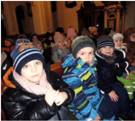
Gespannte Gesichter bei der feierlichen Stimmung