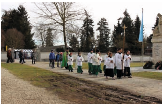
Der Kirchenzug zur Urnenwand