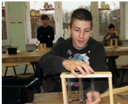
Die fast fertige Blumenvase der Technik Gruppe