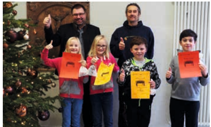
Sieger und Zweite!

weiterhin in den Pausen spielen zu können. Nach den Ferien wird die Mittelschule um den Sieger der Klassen 5-9 kämpfen.