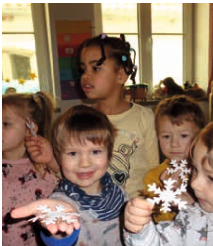
Schneegestöber in den Gruppenräumen!