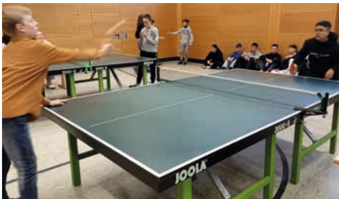
Mit vollem Einsatz