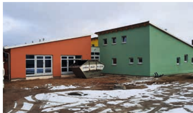
Der Bau des Kindergartens schreitet zügig voran.

Die Firma Bachner hat nach Rücksprache mit dem Bauherren ein Nachtragsangebot in Höhe von 10.544,04 € brutto vorgelegt. Der Nachtrag wurde aufgrund geänderter Beleuchtung und zusätzlicher Stromanschlüsse notwendig. Außerdem mussten zusätzliche Bohrungen in den Holzbalken ausgeführt werden. Das Gremium stimmte dem Nachtrag zu.