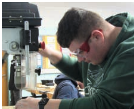
Die Löcher für die Reagenzgläser werden konzentriert gebohrt.