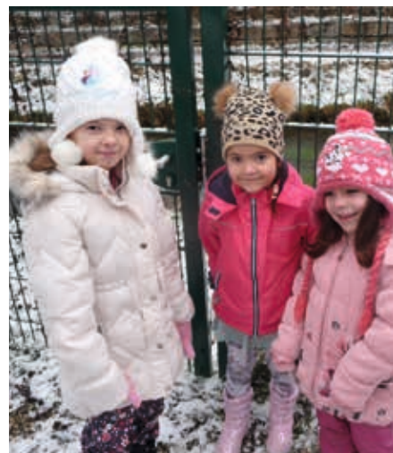
Wir erkunden Glitzerschnee und Eis!