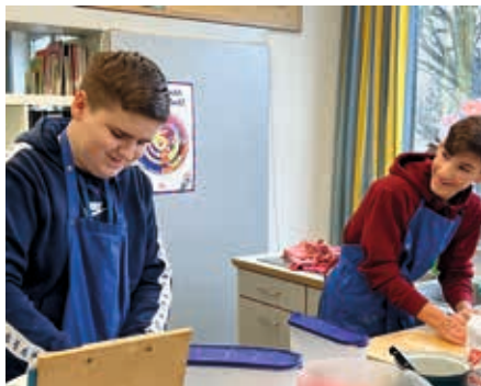
Bei der Herstellung eines Mürbteigs