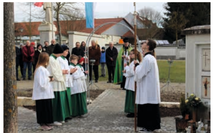
Bei der Segnung