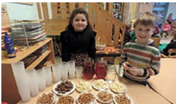
...oder sogar eine Aufführung über...