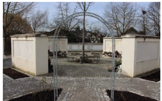
Gesamtansicht der Erweiterung